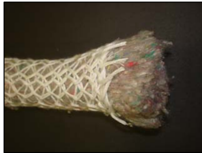
Corde de remplissage pour bords