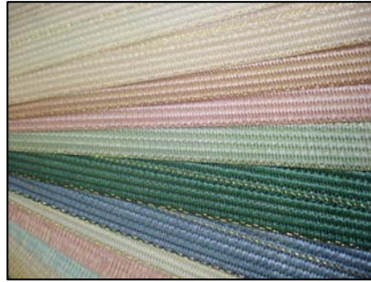
Tissus en fibre de charbon et fibre de verre