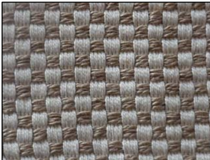
Tissu d'acrylique pour remplir