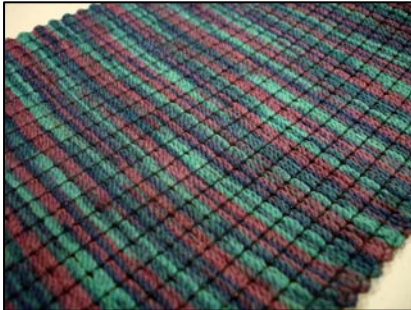
Tissu en polypropylène