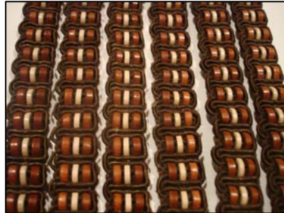
Tissu en cuir